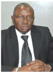
Pr Lamine GUEYE Recteur Université Alioune DIOP Bambey

La Licence en Agrobusiness et en Agro-industrie est créée par l'UADB et Bordeaux Management School (BEM Dakar), avec l'implication de l'Institut Supérieur d'Agriculture et d'Agroalimentaire Rhône-Alpes (ISARA-Lyon), du Centre National de Recherche Agronomique (CNRA) de Bambey et de l'Institut Supérieur de Formation Agricole et Rurale (ISFAR) de l'Université de Thiès. La maquette de cette Licence est totalement conforme aux exigences du système LMD. Son offre de formation est conçue à partir des besoins réels des entreprises agricoles et de l'agroalimentaire.